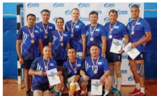
В ДУХЕ СОПЕРНИЧЕСТВА И ДРУЖБЫ