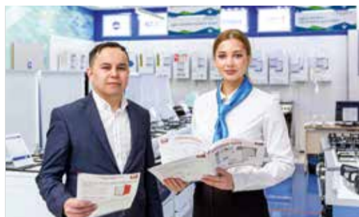
ПОДВОДИМ ИТОГИ ГОДА