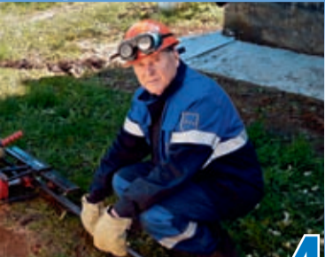
ГОЛУБОЙ ПОТОК НЕ ЗНАЕТ ПРЕГРАД