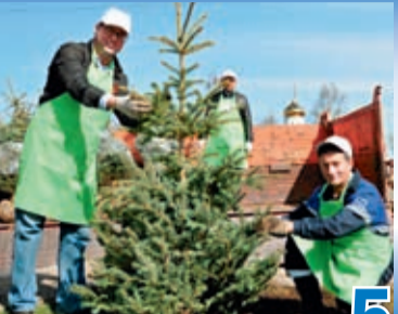
ЗАБОТА О БУДУЩЕМ ЗЕЛЕННОЙ ПЛАНЕТЫ