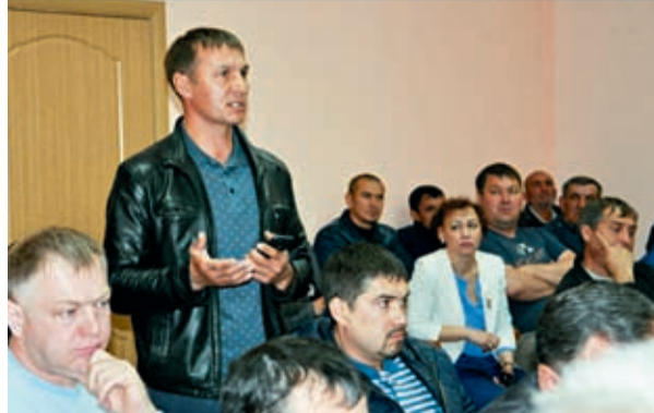
«А у меня вопрос».