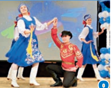
ИСКРЫ СОЗВЕЗДИЯ ТАЛАНТОВ