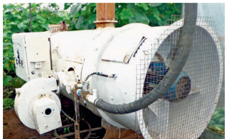
Газовое оборудование с работающей автоматикой.