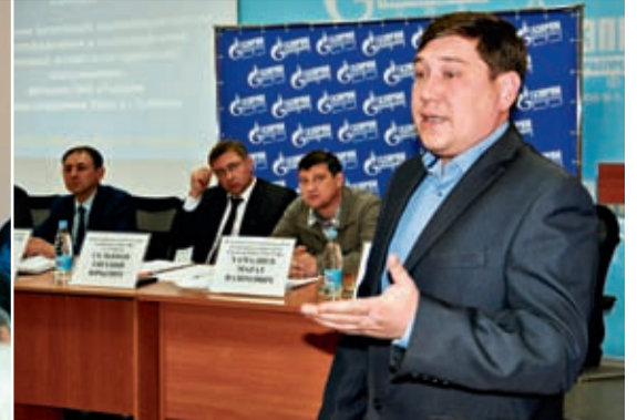
«Мы должны совместно найти пути выхода из ситуации».