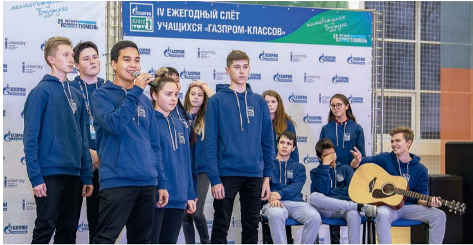
Участники IV ежегодного слёта учащихся «Газпром-классов» (г. Тюмень).

Руководство компании «Газпром межрегионгаз Уфа» сделало новый значимый шаг в подготовке молодых кадров. 2 сентября на базе инженерного лицея № 83 им. М. С. Пинского при Уфимском государственном нефтяном техническом университете (УГНТУ) был открыт Газпром-класс.