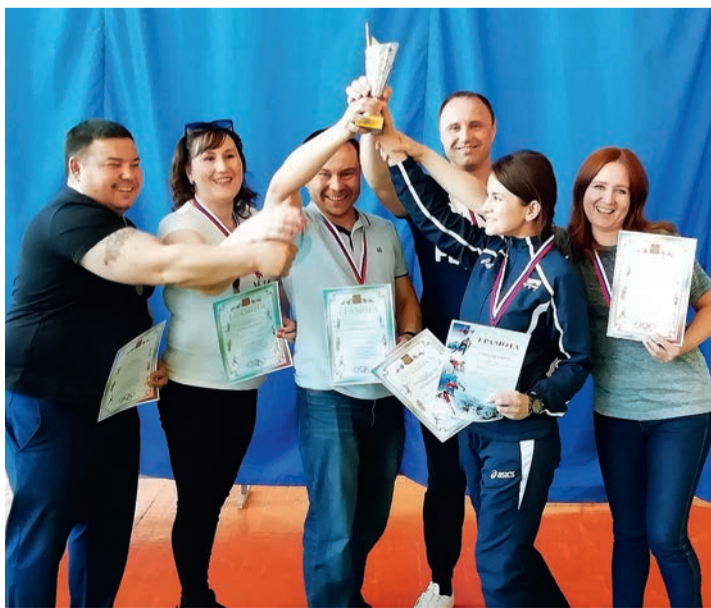
Поздравляем призеров открытого чемпионата!