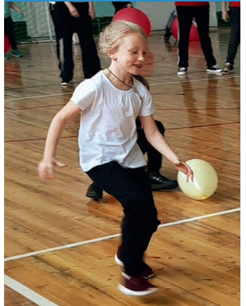
Участники стартов проявили быстроту, смекалку и находчивость.